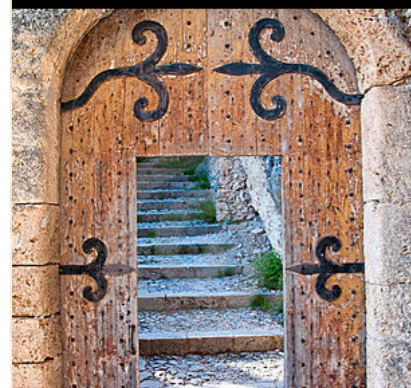
Quinty opent de deuren van het verblijf van Napoleon.