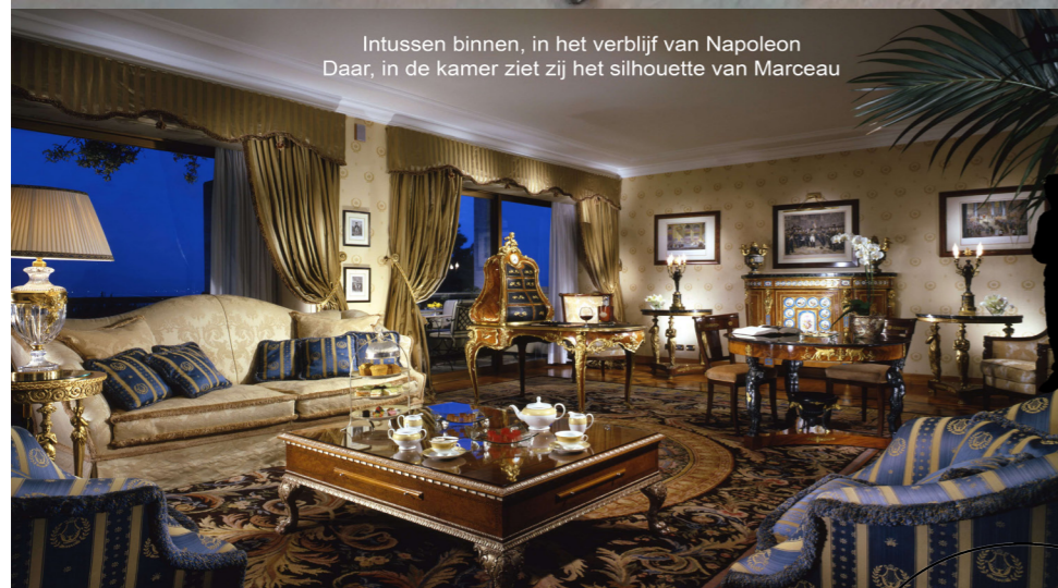
Intussen binnen, in het verblijf van Napoleon Daar, in de kamer ziet zij het silhouet van Marceau

‘Dus dit is nu het plan van onze grote keizer.’ ‘Die kleine knoeier, die denkt dat hij de hele wereld kan veroveren, zonder mij.’ ‘Er staat hem nog een leuke verrassing te wachten bij Waterloo!’